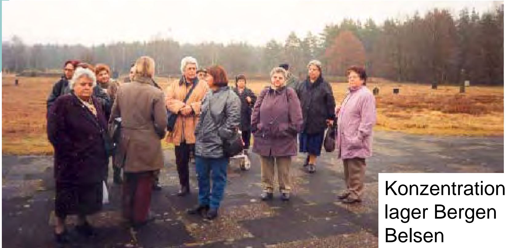
Konzentrations- lager Bergen Belsen